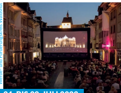
Werbe- und Förderungskreis Waldshut

Auf vier Bühnen in der Fußgängerzone treten insgesamt 16 Jazzkünstler auf. Sowohl regionale als auch internationale Musiker sind dabei.