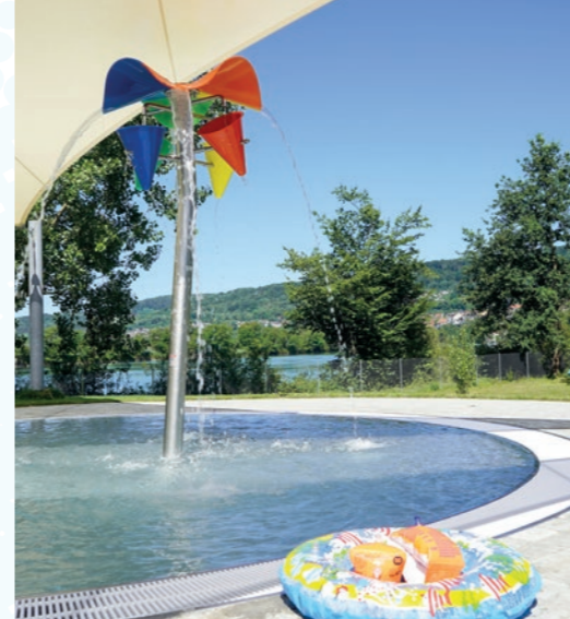
Freibad Waldshut mit einem tollen Planschbereich auch für die kleinen Badegäste.

Freibad Tiengen, Kinderbecken mit breiter Rutsche, Spaß für die ganze Familie.